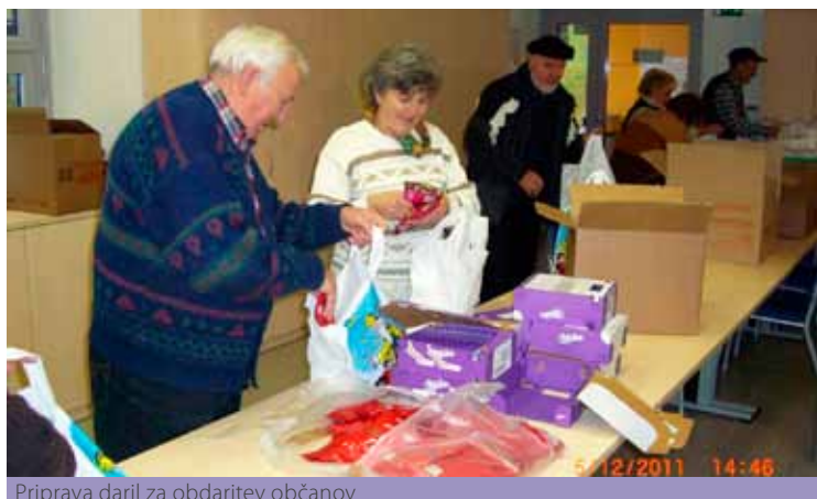
Priprava daril za obdaritev občanov

Prijetne aktivnosti, ki smo jih z veseljem opravili v decembru, so za nami. Obiskali in obdarili smo starejše občane, tudi tiste po domovih za upokoјence in prizadete. Priredili pa smo tudi srečanja ob zaključku leta, tako v okviru sekcij kakor tudi za ožje sodelavce društva. Za člane društva pa smo to opravili na »Ribičij« v Mariboru. Bilo je veselo, nepozabno.