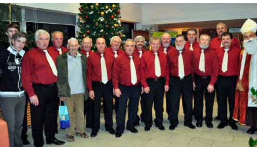
Miklavžev koncert MoPZ DU Dobrna

V dogovarjanju so tudi izobraževalne vsebine, kot so tečajji tujih jezikov in podobno. Realizacija tega pa je odvisna od interesov med člani oziroma krajanji. Predstavljeni program se lahko dopolni. Dopolnitve pa bodo vključene v program, v kolikor bodo imele širšo podporo članstva in jih bo v naših razmerah možno realizirati.