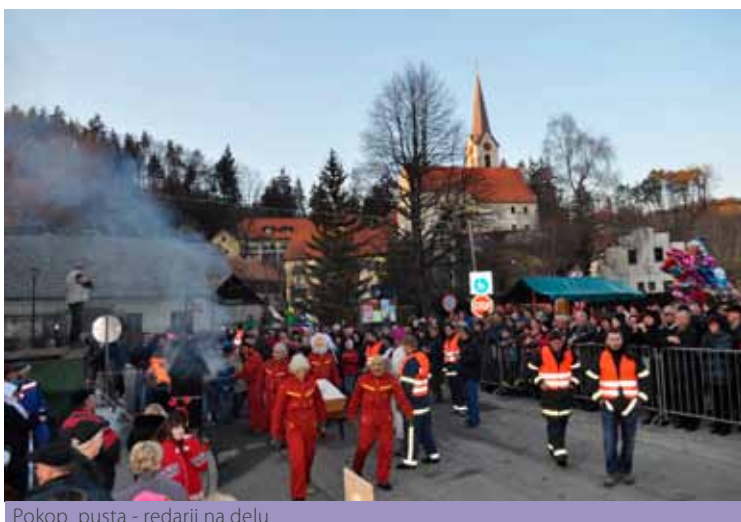
Pokop pusta - redarji na delu

➤ Januarja in februarja 2012 je bil v dvorani gasilskega doma Dobrna organiziran tečaj za vodjo skupine. Organizator tečaja je bila GZ Vojnik – Dobrna. Pogoje za opravljanje zaključnega izpita (udeležba na predavanjih) je izpolnilo nekaj več kot 25 tečajnikov, ki so v nedeljo tudi vsi uspešno opravili izpit za vodjo skupine. Zahvala za uspešno vodenje in izvedbo tečaja gre v prvi vrsti vsem predavateljem in gostitelju, tečajnikom pa čestitke ob uspešno opravljenem zaključnem izpitu.