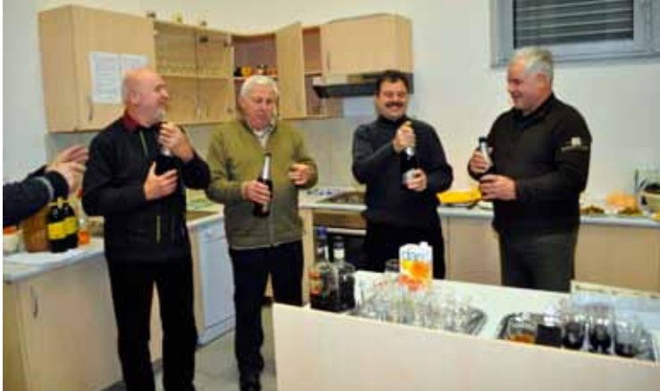
Okrogli jubilanti v sekcijah

starejške«. Istemu cilju bodo sledile tudi majhne pozornosti, kot so: obiski jubilarov, obiski in obdaritev starejših občanov ob novem letu, poklon praporčaka umrlim in še kaj.