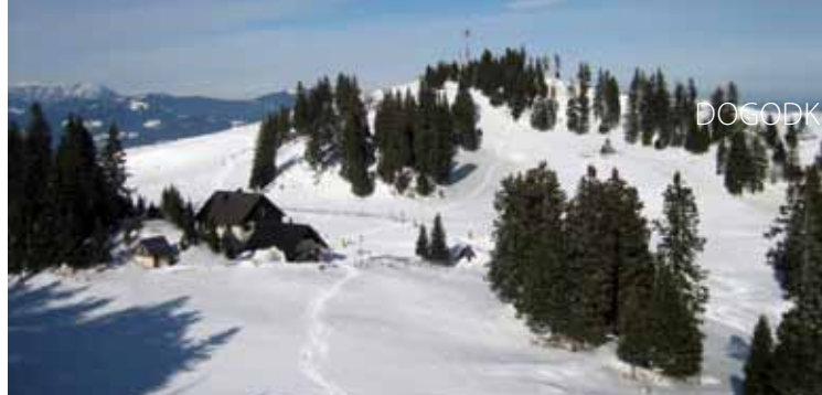
Dom na Menini planini

To je tudi najvišji vrh sicer 10 km dolge in 5km široke prostrane Menine planine, ki poteka od Vranskega do prelaza Črnivec in ločuje Zadrecko oz. Gornje Savinjsko dolino od Tuhinjske doline. Ob povratku do kočje sta nas tam pričakala vodnika iz PD