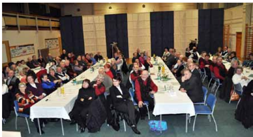
Zbor članov DU Dobrna 2012

Prav tako je za nami zbor članov društva. Ta je bil letos volilni, kar je povzročalo dodatne aktivnosti in napore. Predsednik, blagajničarka in tajnica smo le s težavo prevzeli nadaljnje opravljanje teh zahtevnih nalog. Ker novih vodstvenih kadrov nismo uspeli pridobiti, je UO društva doživel le manjšo dopolnitev, sicer pa je ostal v enakem sestavu.