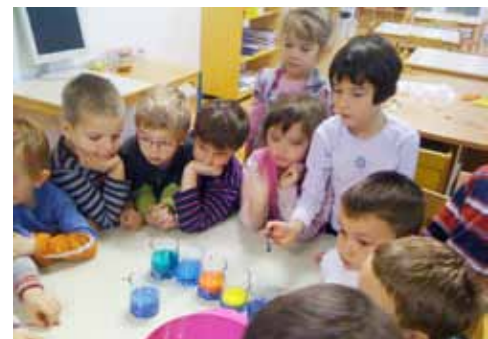
Poskusi z vodo 5. skupina

Najmlajši smo nekaj časa namenili pticam. Izdelali smo ptičjo hišico iz papirja-lepljenko,