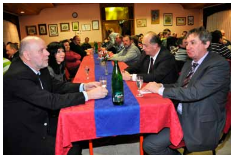
Gostje na zboru članov

➤ 04. 02. 2012 – Nekaj po 3. uri in 30 minut zjutraj je bilo s strani Centra za obveščanje Celje posredovano sporočilo, da je bil opažen požar v naravi na področju spodnje Vrbe. Aktivirane so bile operativne ekipe, ki so odšle na kraj dogodka, ter ugotovile, da gre za manjši požar na odlagališču odpadkov v Zavrhu nad Dobrno ter ga pogasili. Požar ni povzročil gmotne škode.