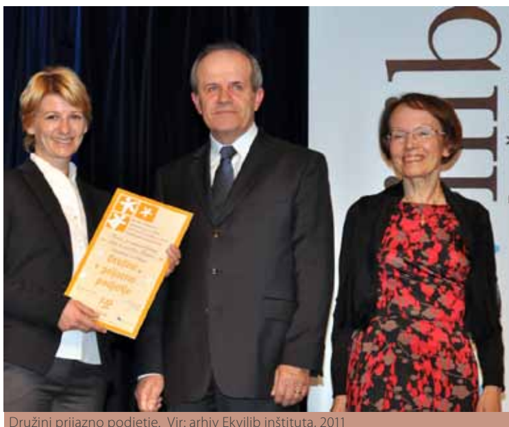
Družini prijazno podjetje.