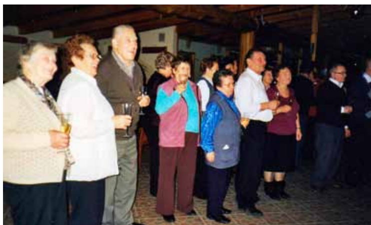
Zaključno srečanje članov DU Dobrna na Ribičiji