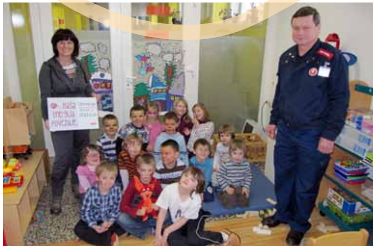
Donacija za vrtec

Tako smo sedaj po donaciji, ki bo otrokom omogočila kakšno novo igračo ali ogled otroške predstave, veseli in ponosni na svojo odločitev, kam nameniti ta znesek. Prilagam tudi sliko, ko