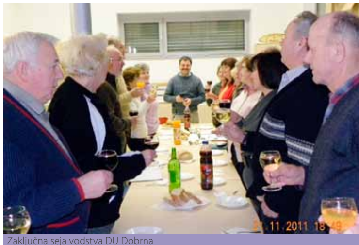
Zaključna seja vodstva DU Dobrna

Prav tako je za nami zbor članov društva. Ta je bil letos volilni, kar je povzročalo dodatne aktivnosti in napore. Predsednik, blagajničarka in tajnica smo le s težavo prevzeli nadaljnje opravljanje teh zahtevnih nalog. Ker novih vodstvenih kadrov nismo uspeli pridobiti, je UO društva doživel le manjšo dopolnitev, sicer pa je ostal v enakem sestavu.