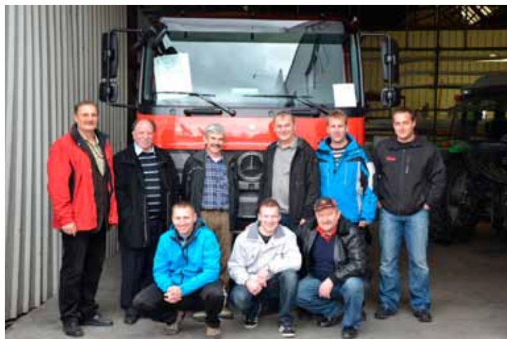
Na ogledu novega gasilskega vozila

➤ 14. 12. 2011 –Skupina gasilcev je obiskala podjetje Elektro Turnšek – GNV d.o.o., kjer bodo opravili nadgradnjo našega novega gasilskega vozila.