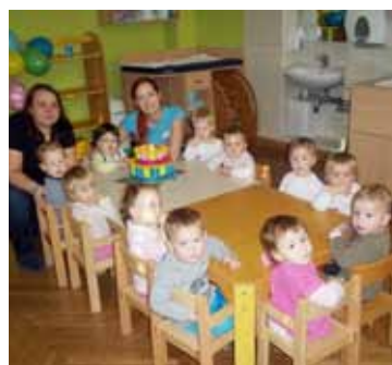
Praznovanje rojstnega dne, 1. skupina

izvedli gibalno uro s padalom. Malčki smo pomočjo tunela iz kartona in blazin pripravili poligon. Redno smo praznovali rojstne dni. Slavljenjci so upih-nili svečke na torti, ostali smo jim peli pesmice, izrekli voščila, izročili darila, se posladkali s sadjem, rajali ob glasbi in plesali z baloni.