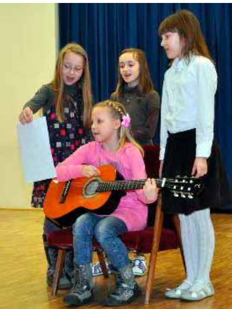
Nastop učencev OŠ Dobrna na Občnem zboru DU Dobrna

V kulturnem programu so nastopale učenke iz 4. razreda, harmonikarja iz 7. razreda in skupina učencev iz 5. razreda, ki smo se predstavili z igrico Snežak in zvončki.