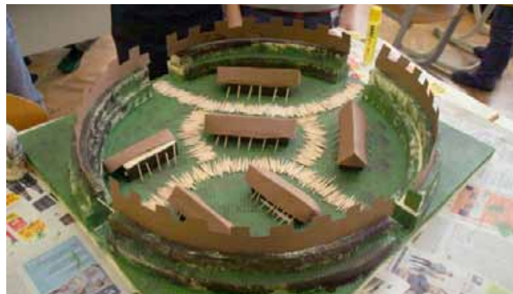
Učenci so v okviru projekta Evropska vas spoznavali Dansko