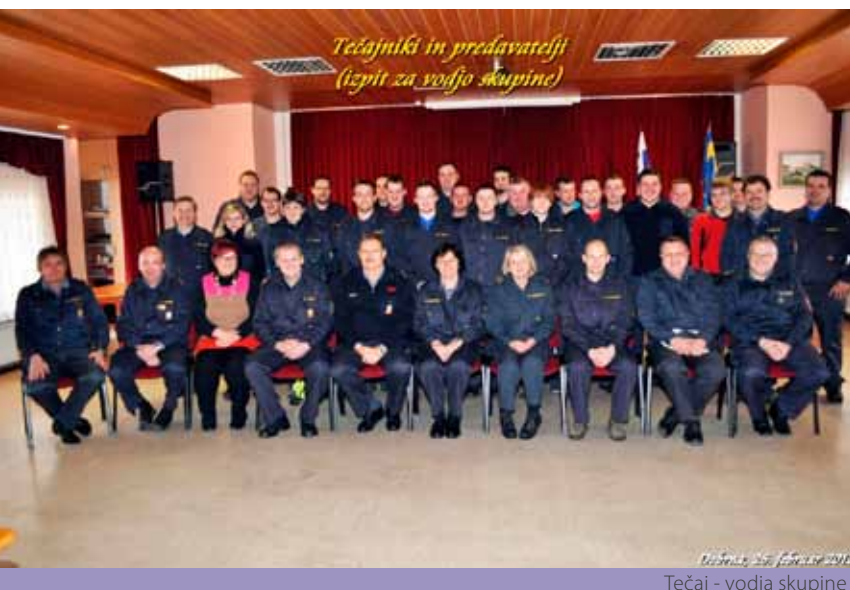
Tečaj - vodja skupine

➤ Januarja in februarja 2012 je bil v dvorani gasilskega doma Dobrna organiziran tečaj za vodjo skupine. Organizator tečaja je bila GZ Vojnik – Dobrna. Pogoje za opravljanje zaključnega izpita (udeležba na predavanjih) je izpolnilo nekaj več kot 25 tečajnikov, ki so v nedeljo tudi vsi uspešno opravili izpit za vodjo skupine. Zahvala za uspešno vodenje in izvedbo tečaja gre v prvi vrsti vsem predavateljem in gostitelju, tečajnikom pa čestitke ob uspešno opravljenem zaključnem izpitu.