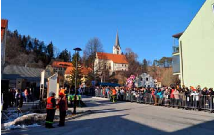
47. pokop pusta na Dobrni