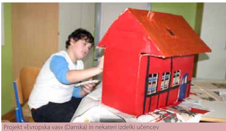
Projekt »Evropska vas« (Danska) in nekateri izdelki učencev

V ponedeljek, 6. 2. 2012, smo na Osnovni šoli Dobrna imeli tehniški dan z naslovom Evropska vas. Na podlagi Andersenovih pravljic so učenci prvega razreda izdelovali lutke, drugi razred je izdeloval knjigo z ilustracijami (Deklica z vžigalicami), učenci tretjega razreda so slikali tipično dansko vas, učenci četrtega razreda so ilustrirali Vikinge, ki so jih pozneje tiskali, peti razred pa je izdeloval kanal Nyhavn. Fantje 6. razreda so izdelovali vojaške tabore, deklice pa danske poštna nabiralnike.