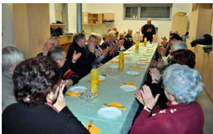
Zaključno srečanje sekcij društva