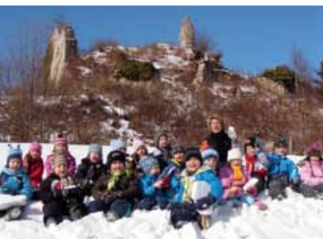
Zimski pohod na Kačji grad, 5. skupina

V 5. skupini smo spoznavali pojem čas s pomočjo koledarja, ure, ... Odšli smo v City center v Celje, kjer smo sestavljali lego kocke. Ko smo dočakali sneg, smo precej časa namenili igram na prostem. Odšli smo na pravi zimski pohod do Kačjega gradu.