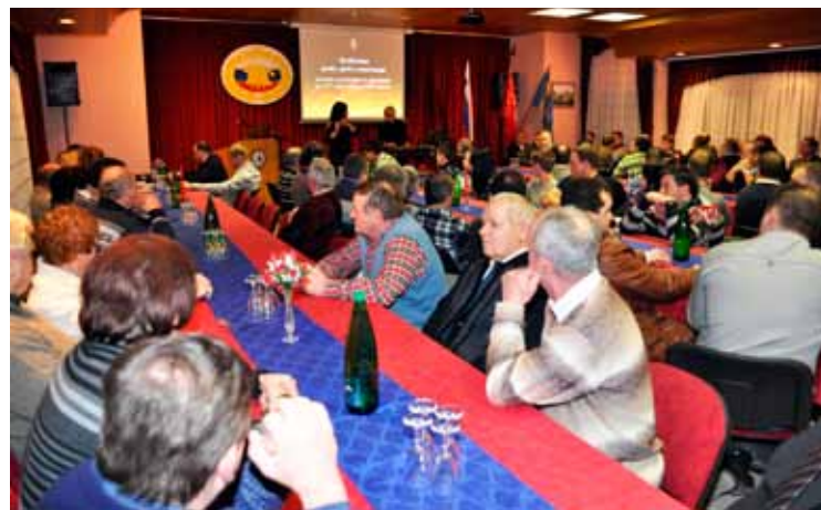
Zbor članov PGD Dobrna

organov društva, v katerih so predstavili delo društva v letu 2011 ter naloge in cilje društva za leto 2012. Po končanem uradnem delu so spregovorili še gostje, ki so se zahvalili za dobro in vzorno sodelovanje v preteklosti z željami, da bi ostalo tako tudi v bodoče. Zatem je sledila še podelitev gasilskih napredovanj ter priznanj za dolgoletno delo v gasilstvu, po podelitvi pa ob prijetnem druženju še pogostitev udeležencev zbora.