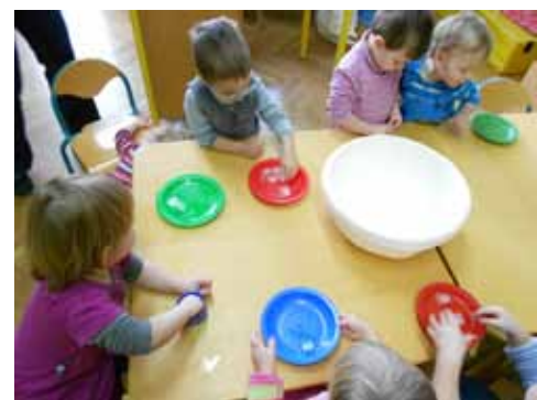
Igra z ledom, 2. skupina

V 2. skupini smo ugotavljali točnost različnih sipkih snovi v vodi, nato pa ugotavljali njen okus (sladko, kisl, slano). Naredili smo milne mehurčke, jih s pomočjo slamice pihali.