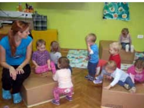
Igra s škatlami, 1. skupina

vanjo pa odtisnili dlani različnih barv. Nastali so pisani ptički. Ptičkom smo nasuli semena na okensko polico in jih opazovali. »Učili« smo se matematiko z velikimi kartonastimi škatlami, različnih višin. Uporabljali smo prostorske odnose in se igrali z odpadno embalažo, ki je otrokom služila za sestavljanje, sedenje, zlaganje, nalaganje ... Skozi tulce smo kotalili žogice iz časopisa, plezali v škatle, na škatle.