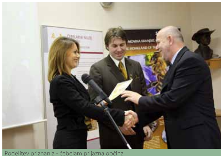
Podelitev priznanja - čebelam prijazna občina

Med podjetji so priznanja prejela naslednja podjetja: