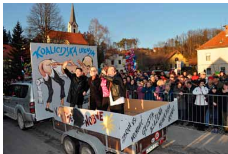
2. voz PGD Dobrna