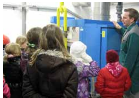
Učenci 4. razreda so podrobno spoznali šolsko kurilnico

spremljati naprave v kurilnici, da bi ne prišlo do napak v delovanju peči ali celo puščanja plina. Na nepravilno delovanje sistema ogrevanja ga v skrajnem primeru opozori tudi alarm. Takrat pa je potrebno hitro ukrepanje. To se k sreči še nikoli ni zgodilo. Vsi smo bili veseli, da smo vedenje o centralni napeljavi naše šole še praktično spoznali.