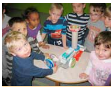
Moj tovornjak, 4. skupina

Igralnica 4. skupine se je spremenila v cestišče s številnimi križišči. Na njej ni manjkalo prehodov za varno prečkanje ceste, pa tudi na prometne znake nismo pozabili. Le-te smo izdelali sami in jih postavljali na cesto. Skupaj smo ugotavljali namembnost le-teh, hkrati pa bili prijetno presenečeni, saj jih večina takoj prepozna tudi v prometu. Iz odpadne embalaže smo si naredili domišljajska vozila in prepevali pesmice o avtomobilu.