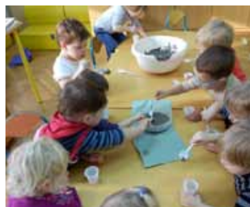
Mešanje betona, 2. skupina

Na željo otrok smo v skupini naredili pravo gradbišče. S pomočjo kamenčkov, odpadnih škatel avtomobilov, delovnih strojev in različnih konstruktorjev smo gradili hiše, mostove in železnice. Pripravili smo si pravi beton in ga s pomočjo plastičnih žlic napolnili v lončke, ter opazovali, kako se je trdil.