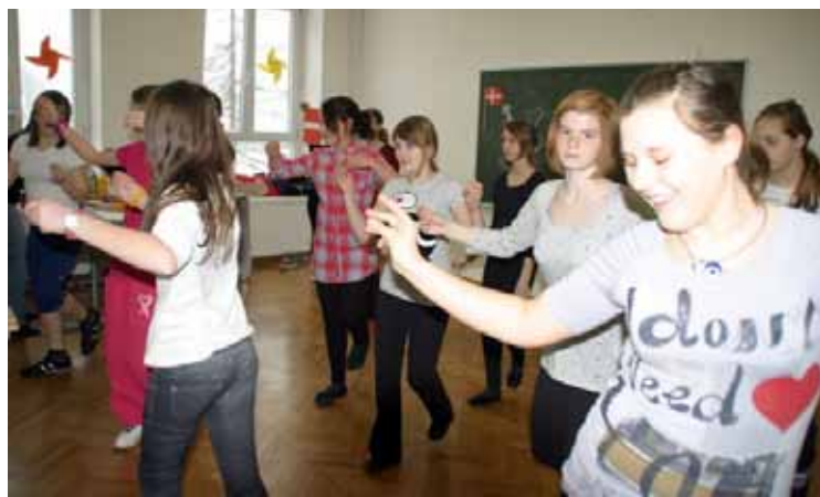
Utrinek s projekta Evropska vas (Danska)

vali smo tudi spletno stran ter fotografirali delavnice. Učenci so povedali, da so jim bile delavnice všeč in da so se imeli 'fajn'.