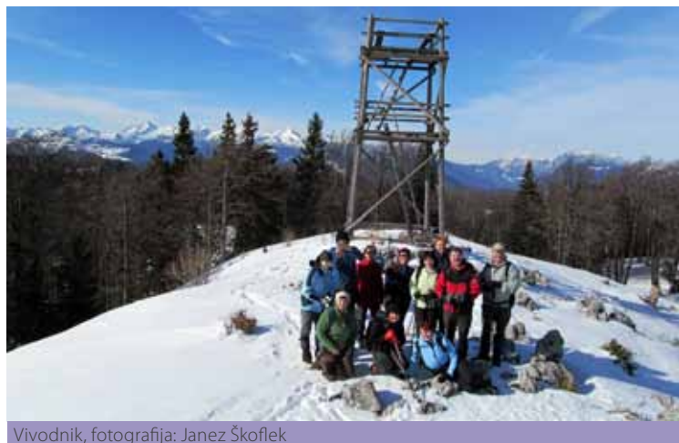
Vivodnik, fotografija: Janez Škoflek

Gornji Grad in nas mimo Medvedje jame, jezera Biba in mnogih zametov peljala na skrajni vzhodni rob Menine planine, na planoto Šavnice, z Golim vrhom (1231m), od koder smo občudovali polovico Slovenije. Čeprav smo skoraj celo pot po grebenu gazili sneg, ki se nam je vdiral tudi čez kolena, smo bili nad razgledi več kot navdušeni in smo napore v trenutku pozabili. Čakal nas je še strm spust skozi gozd v dolino, točneje v Bočno, kamor smo prišli že v trdi temi in pri prijaznih vodnikih turo zaključili z okusnim »tolkecom«.