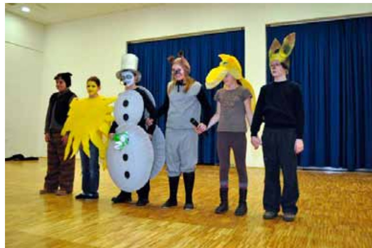
Utrinek z nastopa učencev OŠ Dobrna na Občnem zboru DU Dobrna

Komaj smo čakali, da se predstavimo. Trema je bila precej huda. Prišli so nas poslušati tudi nekateri starši. Bilo je odlično. Na koncu smo se vsi nastopajoči zbrali in se priklonili. Predsednik društva pa se nam je zahvalil. Poslušalci so zaploskali, na našem obrazu pa se je prikazal nasmeh. V učilnici smo imeli pogostitev. Bili smo