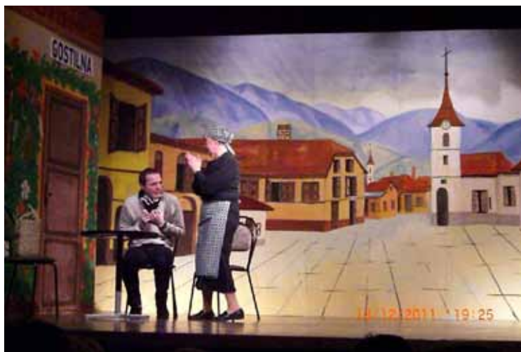
Gledališka predstava v Vojniku

➤ 13. 12. 2011 –Dramska sekcija Kulturnega društva iz Škofje vasi je v Kulturnem domu Vojnik uprizorila komedijo z naslovom »Čenče«. Ogled komedije je bil namenjen vsem društvom GZ Vojnik – Dobrna.