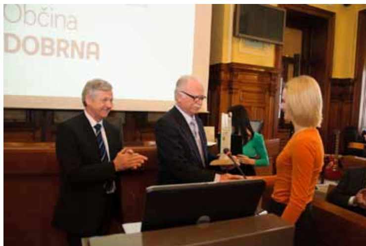
Podelitev priznanja Občini Dobrna za najbolj zeleno občino 2011 do 5000 prebivalcev

Posebna priznanja za najbolj zelene občine na področju ravnanja z odpadki pa so prejele občine Borovnica, Vrhnika in Velenje.