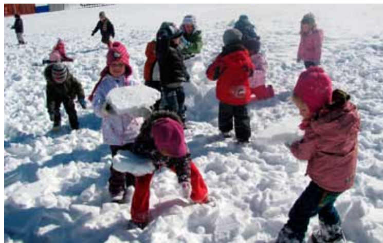
Veselje na snegu, 4. skupina

Mesec februar nas je obdaril s snegom. Pravijo, da pust preganja zimo, a mi le-te ne damo. Starejši smo vsakodnevno uživali na snegu, čeprav za oblikovanje snežakov še ni bil najbolj primeren. Lovljenje snežink, opazovanje le-teh na topli dlani, hoja po celem snegu, iskanje sledi, primerjanje le-teh med sabo, iskanje skritega zaklada...in še bi lahko naštevali.