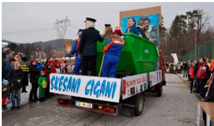
Pustni karneval v Galiciji

➤ 19. 02. 2012 - Člani PGD Dobrna smo se, podobno kot v Novi Cerkvi, z enim pustnim vozom udeležili pustnega karnevala v Galiciji. Karneval, ki ga prirejajo v Galiciji, je v sedanjem obsegu bolj namenjen otrokom, bilo pa je zelo vzpodbudno, da se je našemu vozu pridružilo še nekaj pustnih vozov iz okolice Galicije in vse kaže na to, da bi se lahko ta prireditve v Galiciji v prihodnosti še bolj razširila, »prijela«.