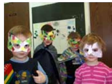
Maske, 3. skupina

V vseh skupinah smo si uredili kotichek »šmelenja« z različnimi oblačili in modnimi dodatki. Izdelovali smo maske in pustne klobuke iz časopisnega papirja, na katere smo nalepili pisane papirčke različnih oblik. Igrali smo na pisane ropotuljice, ki smo jih napravili sami. Na papirnate vrečke smo lepili barvne trakove, zato so nastale zanimive maske.