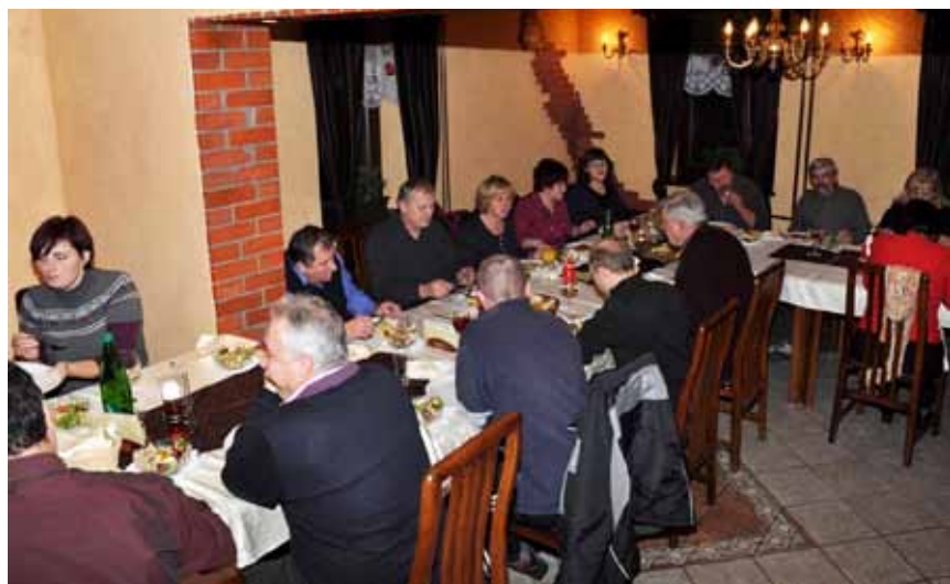
Zaključna seja UO PGD Dobrna

➤ 21. 12. 2011 - Zaključna seja UO na kateri je bilo podano poročilo o opravljenem delu v preteklem letu, finančno poročilo in plan nabave nujne opreme za leto 2012.