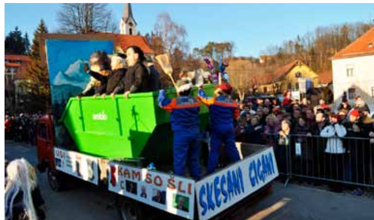
1. voz PGD Dobrna