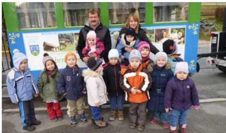
Vožnja s turističnim vlakom, 3. skupina

Najmlajši smo nekaj časa namenili pticam. Izdelali smo ptičjo hišico iz papirja-lepljenko,