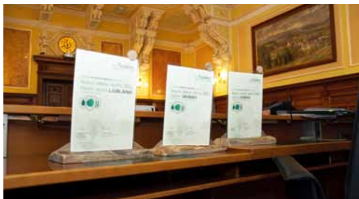
Priznanja najbolj zelenim občinam 2011

Zmagovalne občine smo poleg častnega naziva prejele tudi članstvo v Zelenem omrežju Zelene Slovenije.