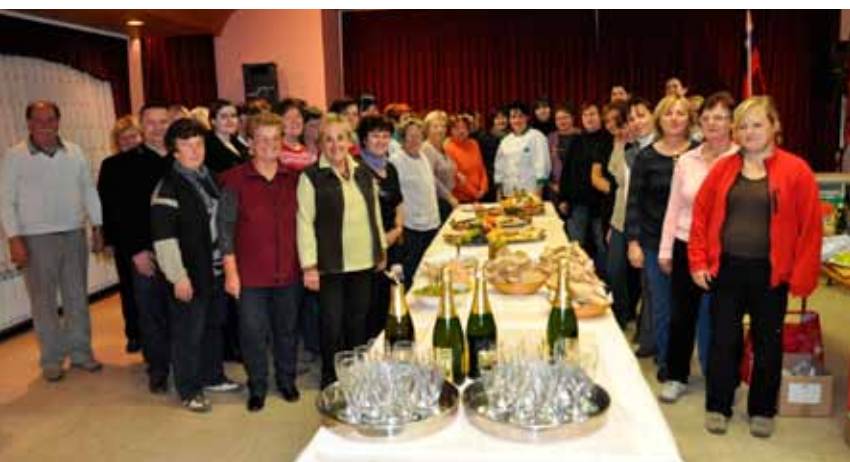
Delavnica - Dobrna 2011

➤ 07. 12. 2011 – Komisija za delo s članicami pri GZ Vojnik - Dobrna je za svoje članice v dvorani gasilskega doma na Dobrni organizirala prednovoletno delavnico, na kateri je bilo prikazano izdelovanje, priprava in dekoracija narezkov.