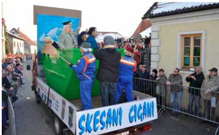
Na pustnem karneval v Novi Cerkvi

➤ 19. 02. 2012 - Člani PGD Dobrna smo se, podobno kot v Novi Cerkvi, z enim pustnim vozom udeležili pustnega karnevala v Galiciji. Karneval, ki ga prirejajo v Galiciji, je v sedanjem obsegu bolj namenjen otrokom, bilo pa je zelo vzpodbudno, da se je našemu vozu pridružilo še nekaj pustnih vozov iz okolice Galicije in vse kaže na to, da bi se lahko ta prireditve v Galiciji v prihodnosti še bolj razširila, »prijela«.